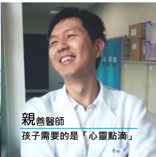
親善醫師 孩子需要的是「心靈點滴」