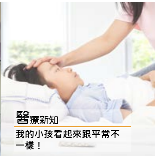
醫療新知 我的小孩看起來跟平常不一樣！