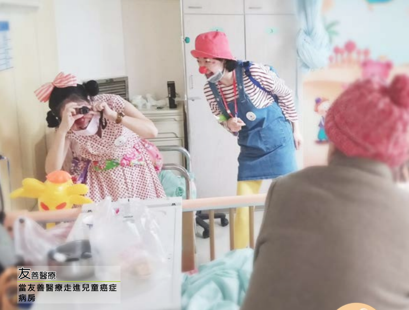
友善醫療 當友善醫療走進兒童癌症病房